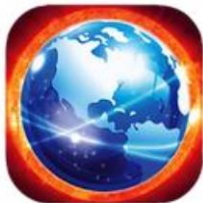
Photon Flash Player

Google Play Store: Photon Flash Player Flash Fox Player