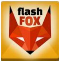
Flash Fox Player

Mit diesen Flash-Player funktioniert der Zeitraffer-Tagesfilm